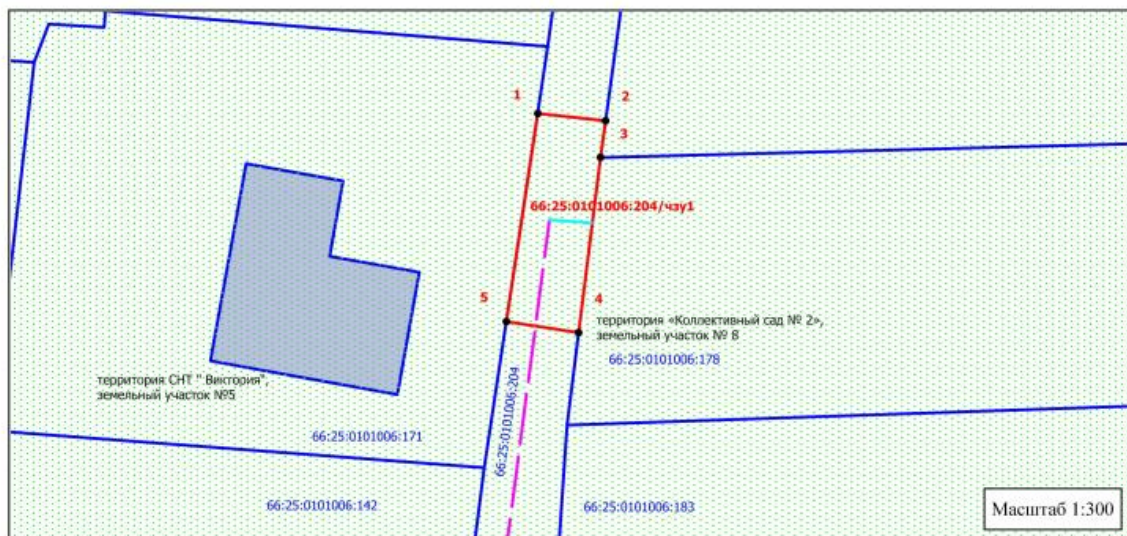
Схема расположения границ публичного сервитута на часть земельного участка с кадастровым номером 66:25:0101006:204 для размещения газопровода низкого давления к жилому дому № 8 "Коллективный сад №2" п. Большой Исток