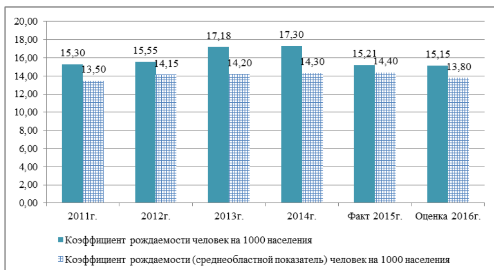
Рис.4 Соотношение коефициента рождаемости в Сыертском городском округе и в Свердловской области

По данным рисунков 3,4 отмечено снижение темпов рождаемости в Сыертском городском округе.