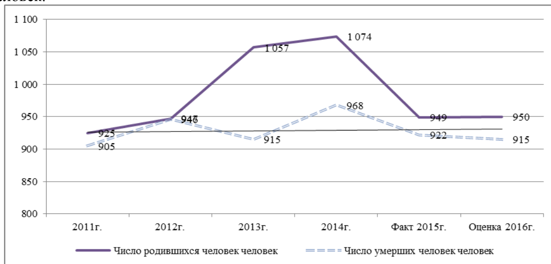
Рис.3 Динамика показателей рождаемости и смертности в Сысертском городском округе

В течение 2015 года численность постоянно проживающего населения на территории округа увеличилась на 275 чел. и по состоянию на 01.01.2016 составила 62519 человек. За 2015 год сохраняется тенденция превышения числа родившихся над числом умерших на 27 человек.