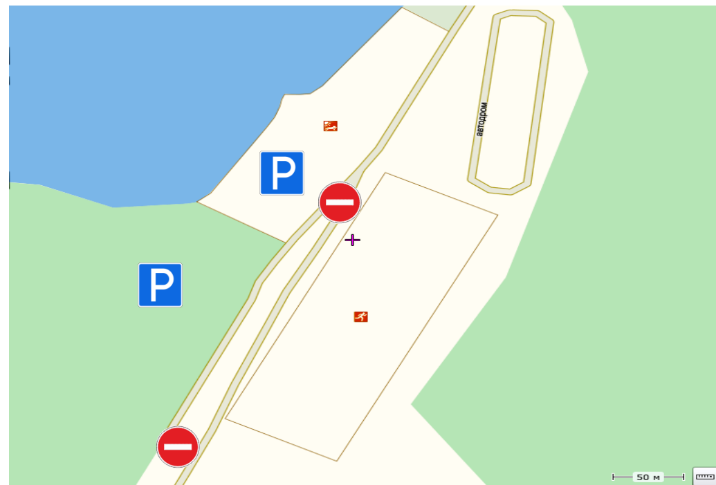
Лыжная база «Спартак»