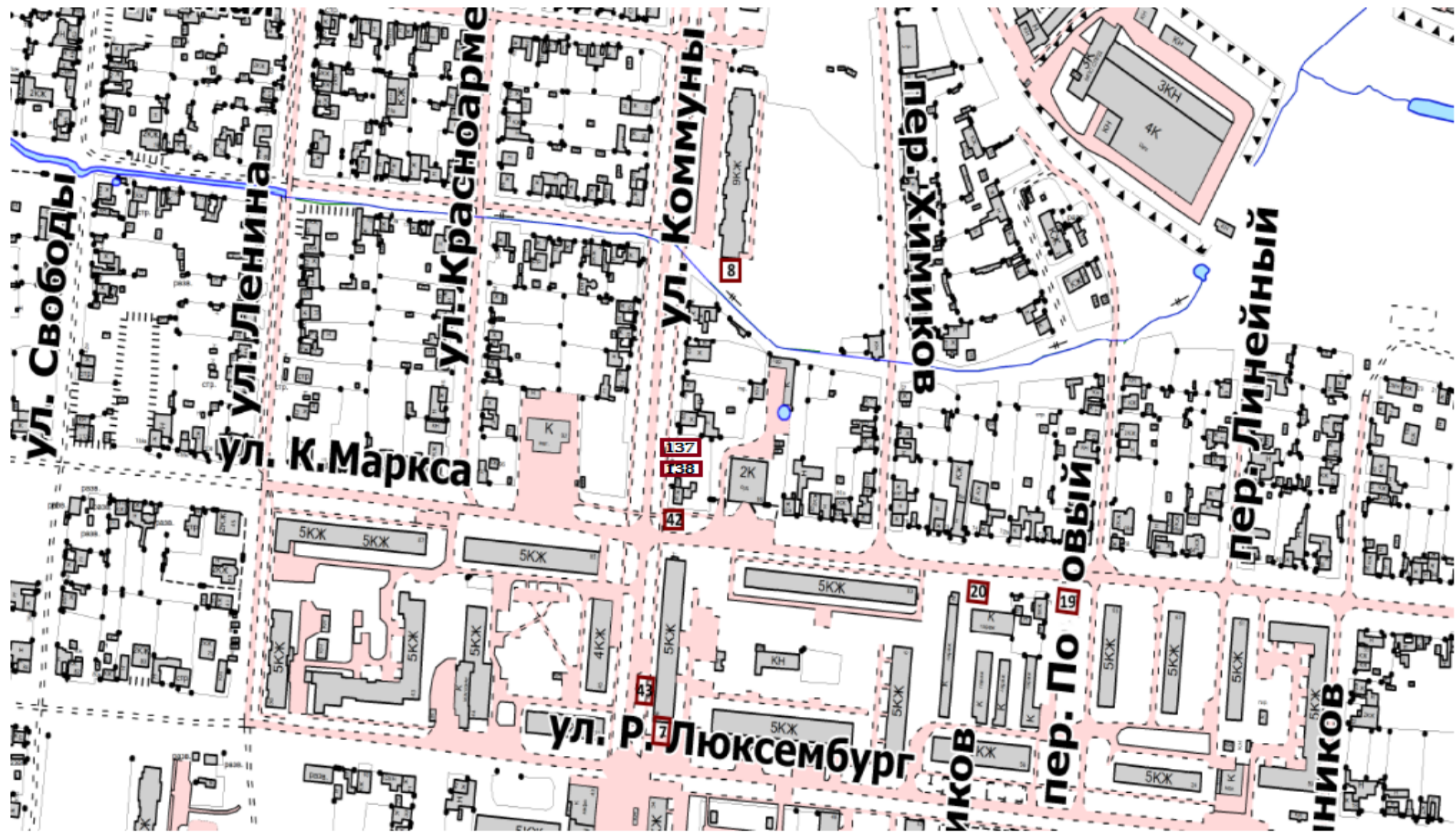
Фрагмент № 5