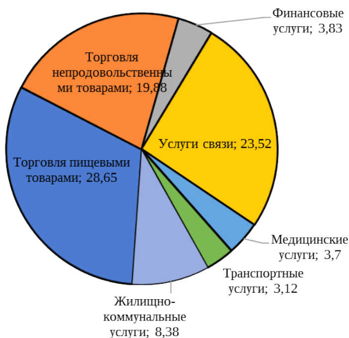
Структура обращений граждан, процентов

Наибольшее внимание при проведении надзорных мероприятий уделялось качеству и безопасности продуктов питания, непродовольственных товаров. Сохраняется наличие на рынке значительного количества некачественных товаров (работ, услуг), в том числе представляющих угрозу для жизни, здоровья и имущества потребителей.