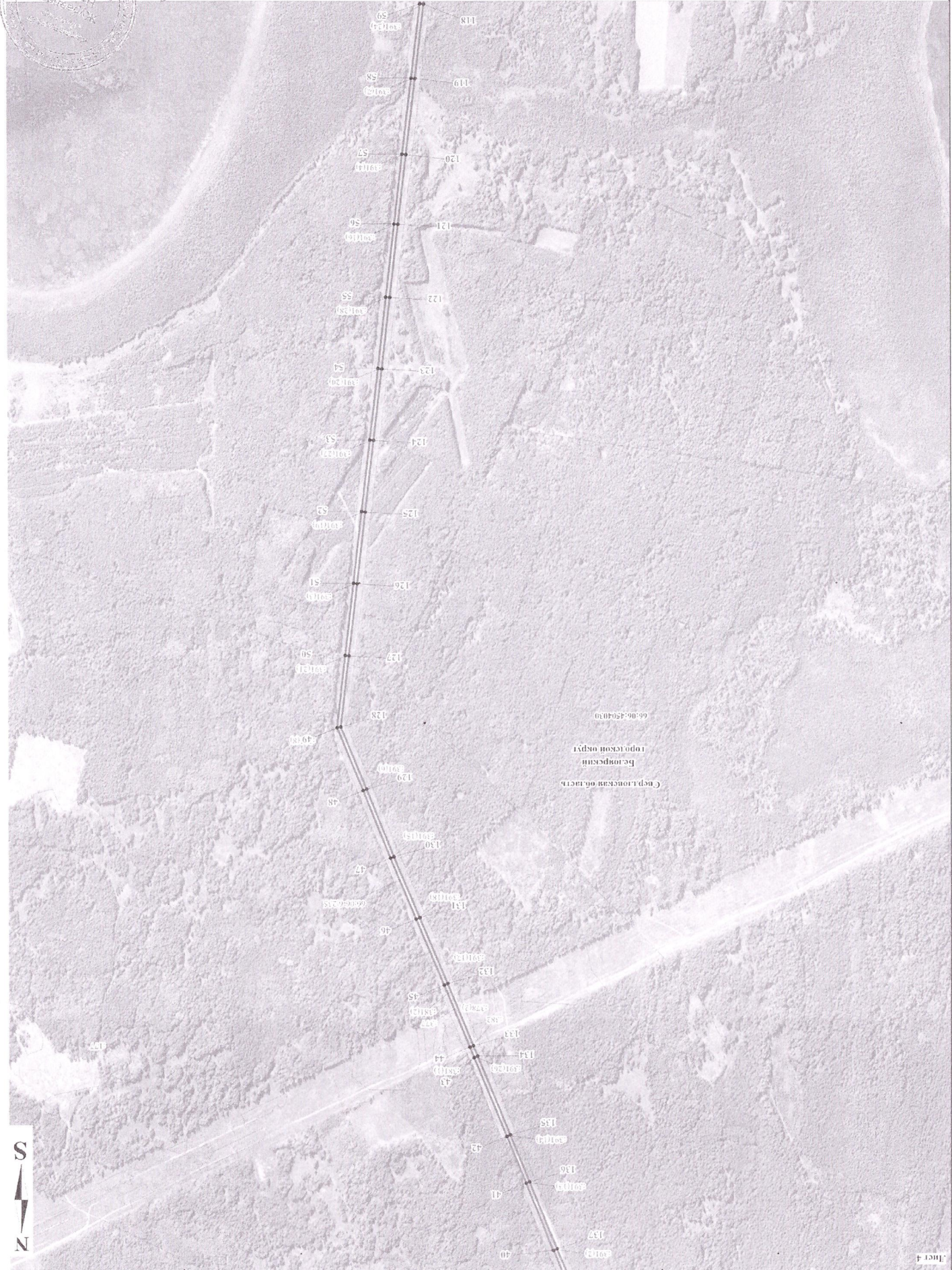
Схема расположения границ участного сервитута