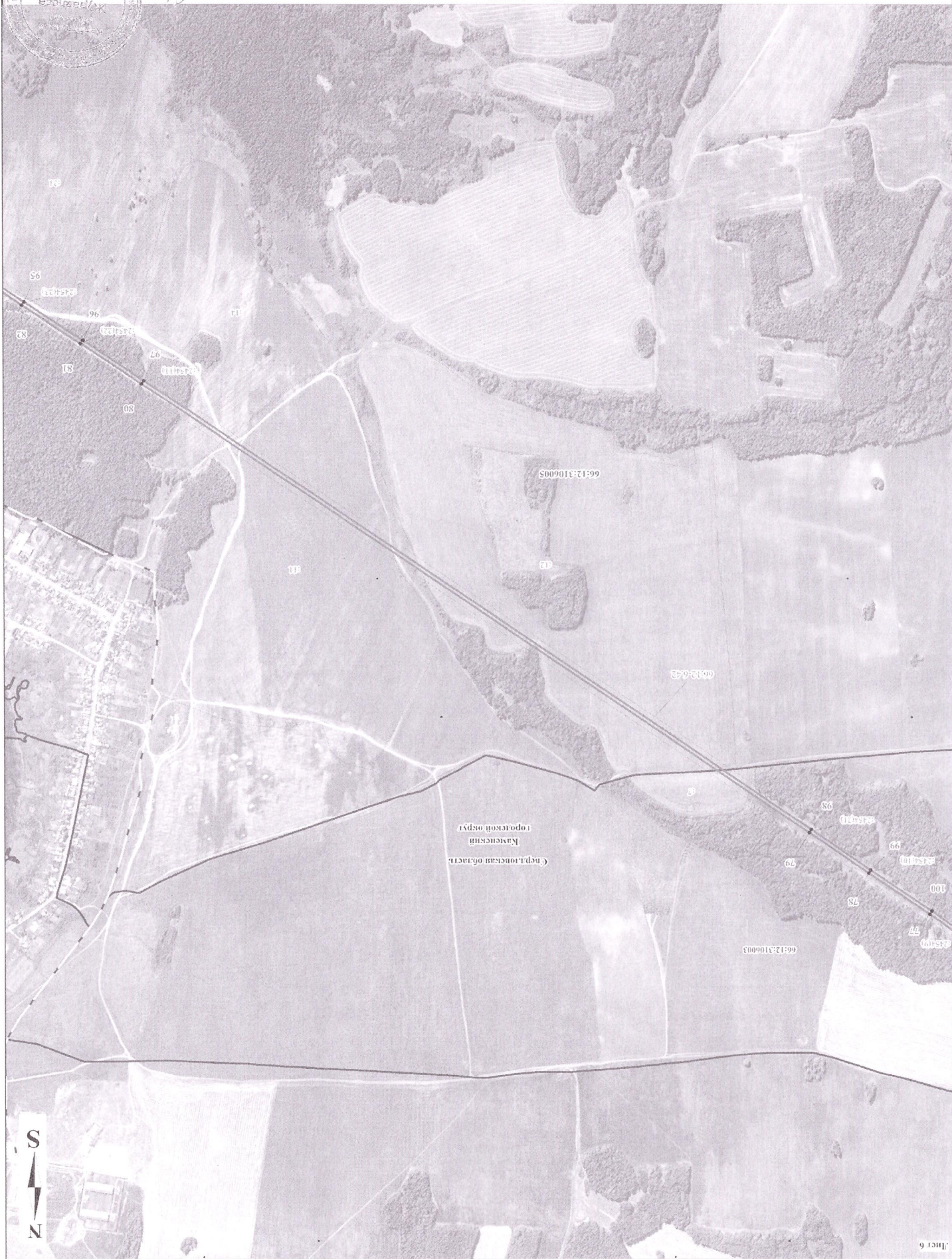
Схема разположения гранично съвпадение