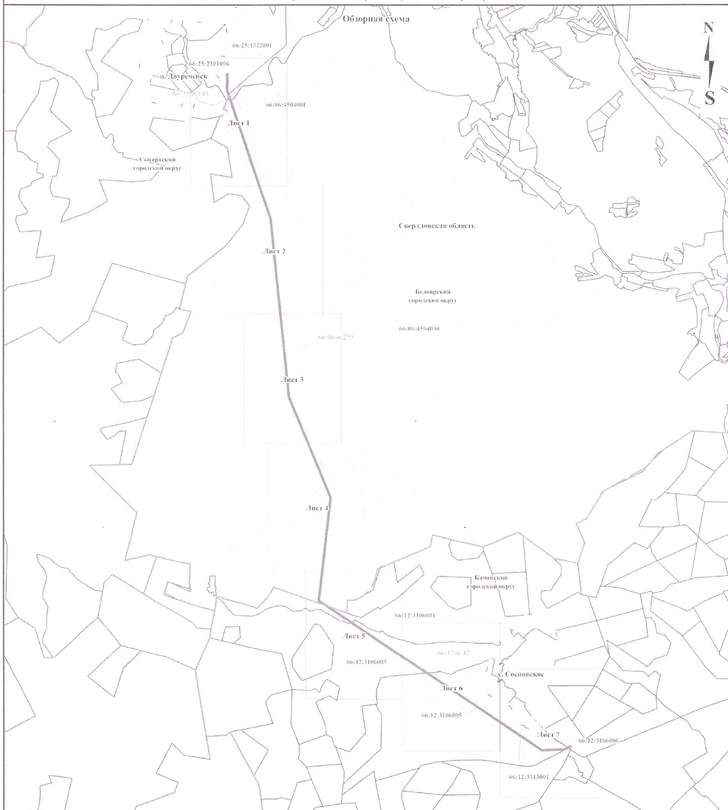
Схема расположения грани публичного сервитута