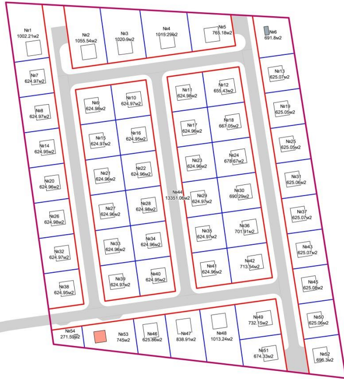
Схема межевания территории

территории дачной территории в 2,9 км юго-западнее п. Бобровский